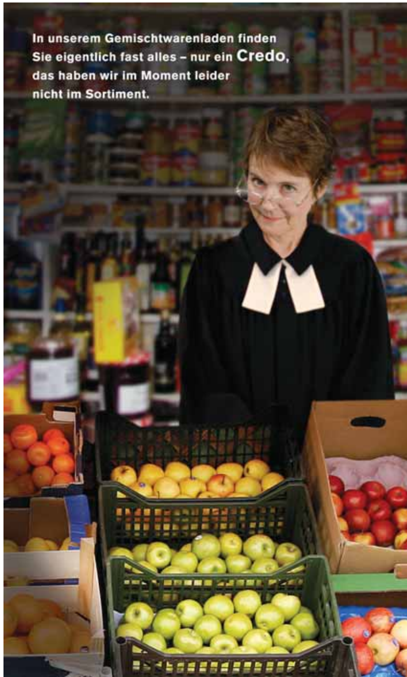
Eine Bildmontage von Daniel Lienhard, Illustrator, Zürich.